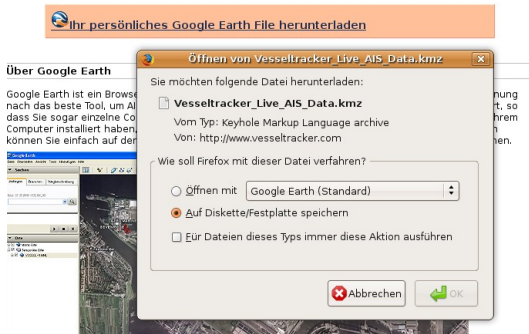
Abbildung 3: Google Earth Datei heruntergeladen

AIS Schiffsplösungen live in Google Earth