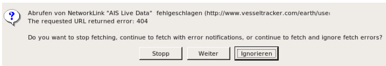
Abbildung 1: Fehlermeldung

Wenn Sie nach dem Starten von Google Earth folgende Fehlermeldung bekommen, klicken Sie zunächst auf den Button Ignorieren . Dadurch verschwindet die Fehlermeldung und die Fehlersuche kann beginnen.